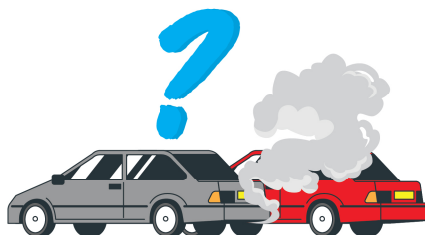
Qualidade e segurança de veículos usados