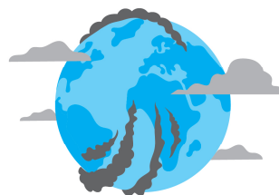
Polluants et émissions nocives pour le climat des véhicules usagés