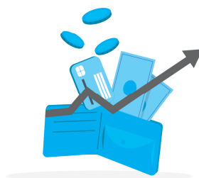
Coûts d'exploitation des véhicules d'occasion